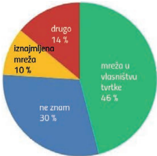
» Odgovori anketiranih glede vlasništva 5G mreža.

Pri tome je zanimljivo, da su tri anketirana iz te grupe potvrdili, da primjenjuju bežičnu tehnologiju za automatski vođena vozila (AVG), što je prema svim očekivanjima jedna od prvih aplikacija 5G tehnologije u industrijskoj automatizaciji.