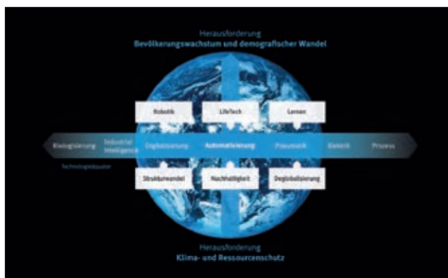
» Plavi svijet, gdje tehnološki ekvator predstavlja sadašnja i buduća tehnološka područja na putu razvoja u klimatski neutralno proizvodnju.

Festo doprinosi globalnoj održivosti na brojnim područjima i to vizualizira s »plavim svijetom«. »S time želimo prikazati, kako tehnologija automatizacije može uravnotežiti potrebu za opskrbom svjetskim stanovništvom s jedne strane te zaštitom naših prirodnih resursa i klimatski neutralnom proizvodnjom s druge strane,« pojašnjava Oliver Jung. Plavi svijet u stvari prikazuje nastojanja tvrtke Festo za promjenama industrijske proizvodnje u učinkovitu i klimatski prilagođenu vrstu proizvodnje.