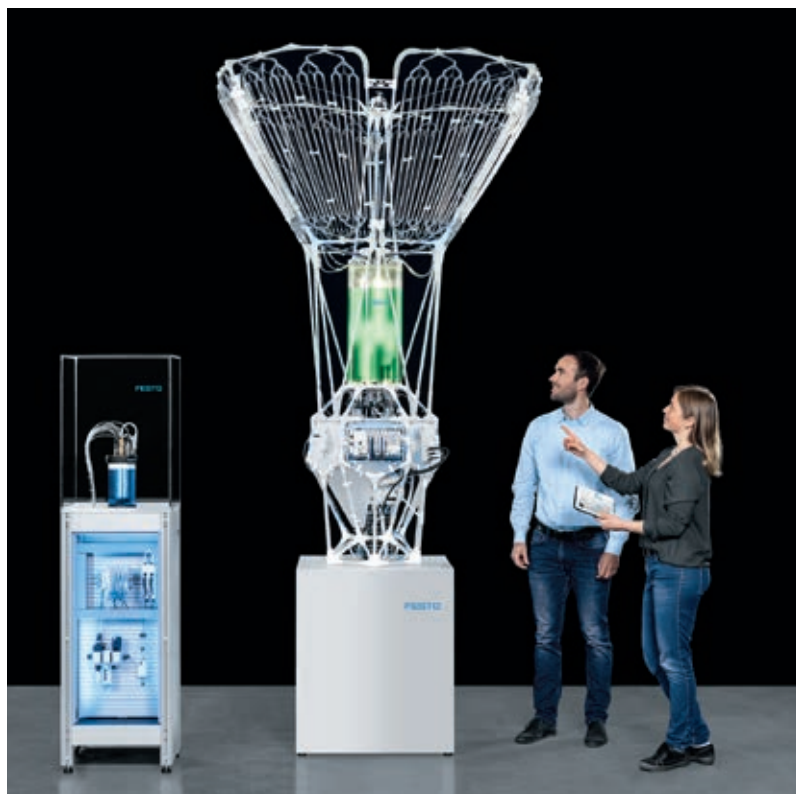
» S istraživačkim projektom PhotoBionicCell tvrtka Festo predstavlja mogući pristup industrijskoj biologizaciji budućnosti.

Osnovna zamisao projekta PhotoBionicCell je uzgoj algi, koje mogu biti prave male klimatske spasiteljice. Već prilikom prirodne fotosinteze na otvorenom, alge su iznimno učinkovite i vežu deset puta više ugljičnog dioksida (CO 2 ) od kopnenog raslinja. U bioreaktorima s odgovarajućim senzorima, upravljanjem i automatizacijom, učinkovitost algi možemo povećati i do sto puta u usporedbi s kopnenim raslinjem. Stoga imaju veliki potencijal za klimatski neutralno, kružno gospodarstvo.